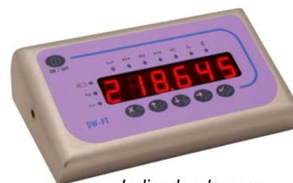
Indicador de peso DW-PT y DW-PT/X

Disponible en 3 formatos: panelable, pared y sobremesa