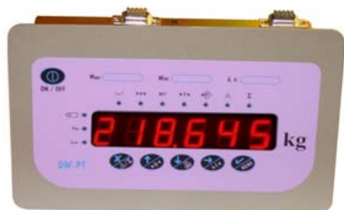
Indicador de peso DW-PT/P