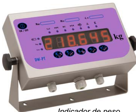
Indicador de peso DW-PT/B